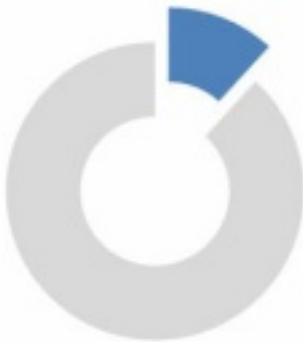
Frauenanteil in Führungspositionen