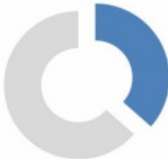
Frauenanteil im nationalen Parlament