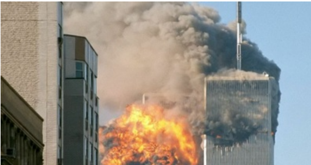
Ein Flugzeug fliegt in ein Gebäude des World Trade Center am 11.9.2001

Die Ereignisse des 11. September 2001 und in dessen Folge der Kampf gegen den Terrorismus haben die internationalen Beziehungen in vielfältiger Weise verändert. Die Bilder der "brennenden Zwillingtürme" in Manhattan haben sich weltweit ins kollektive Gedächtnis gebrannt. Bei den Anschlägen in New York und Washington starben fast 3000 Menschen. Bis heute dominiert der Terrorismus die Bedrohungswahrnehmung vieler Menschen.