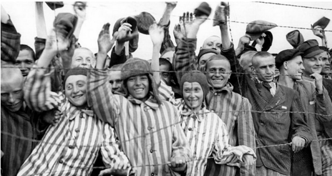
Häftlinge nach der Befreiung des Konzentrationslagers Dachau am 29. April 1945

Am 27. Januar 1945 befreiten sowjetische Soldaten das Vernichtungslager Auschwitz. Hier ermordeten die Nationalsozialisten zwischen 1940 und 1945 mehr als 1,5 Millionen Menschen. Der Jahrestag der Befreiung des Vernichtungslagers Auschwitz wurde im Jahre 1996 in der Bundesrepublik Deutschland als Gedenktag für die Opfer des NS-Regimes ins Leben gerufen. Im Januar 2020 erinnern wir uns zum 75. Mal an die Befreiung von Auschwitz.